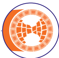
ਨਾ ਫੈਲਣ ਵਾਲਾ ਛਾਤੀਆਂ ਦਾ ਕੈਂਸਰ